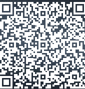
Struttura Federale Nazionale Quadriennio 2025-2028