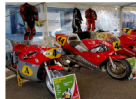
Convenzione FMI singolo motoveicolo: RCA e Tutela Legale da Circolazione Stradale per motoveicoli d'epoca

Il successo di questa iniziativa è dovuto alle vantaggiosissime condizioni della soluzione assicurativa offerta ai Tesserati FMI che possono assicurare il proprio motoveicolo iscritto al registro storico a delle tariffe dedicate ed esclusive sia per i motociclisti che desiderano assicurare un solo motoveicolo che per coloro che necessitano di mettere in copertura più di un motoveicolo: